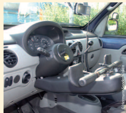
... und die dem mit »schwerer Displenie« geborenen unbegrenzte Mobilität ermöglicht.